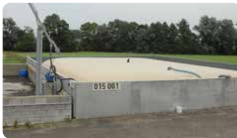
Lager von Flüssigdünger