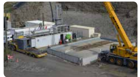
Behandlungsbecken für verschiedenste Abwässer