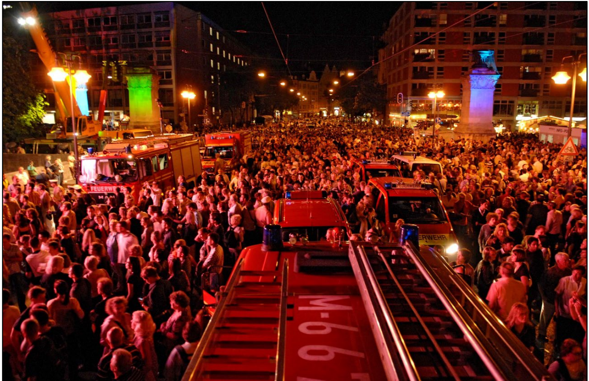
Abbildung 1: Flächig hohe Personendichten im Kontext von Einsatzmaßnahmen bei einer Veranstaltung

Die Personendichte beeinflusst zudem maßgeblich die Bewegungsfreiheit, die Orientierung und die Möglichkeit zur selbstbestimmten Fortbewegung. Kritisch wird eine Situation insbesondere dann, wenn Besucher ihre Bewegungsrichtung nicht mehr frei wählen können, Ausgangsmöglichkeiten nicht mehr klar erkennbar sind und die Fortbewegung durch die Menschenmenge bestimmt wird.