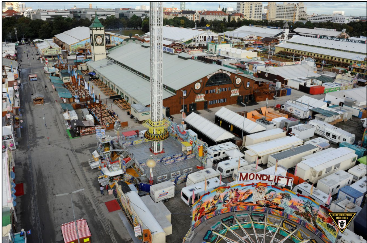
Abbildung 7: dichte Belegung auf einer Veranstaltungsfläche mit Unterschreitung von Abstandsflächen

Hier spielen sowohl die Belange des abwehrenden Brandschutzes (z. B. eine ausreichende Löschwasserversorgung), als auch besondere Brandgefährdungen (umfangreiche Nutzung pyrotechnischer Gegenstände und/oder offenen Feuers, hoher Anteil an Aufbauten aus brennbaren Stoffen, Unterschreitung von Abstandsflächen (siehe Abbildung 8), enge Altstadtlage (siehe Abbildung 7), u. Ä.) eine wesentliche Rolle.