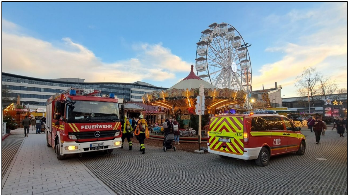
Abbildung 4: Darstellung der Notwendigkeit von Flächen für die Feuerwehr im Veranstaltungsbereich

Die innere Gestaltung in Hinblick auf die Flächenbeschaffenheit ist dahingehend zu bewerten, ob die Veranstaltungsfläche für die Mitwirkenden und Besucher im Regelbetrieb sicher nutzbar ist (vorhandene Hindernisse, Topografie und Bodenbeschaffenheit) und auch bei wahrscheinlichen Störungen (z. B. Unwetter) sicher nutzbar bleibt.