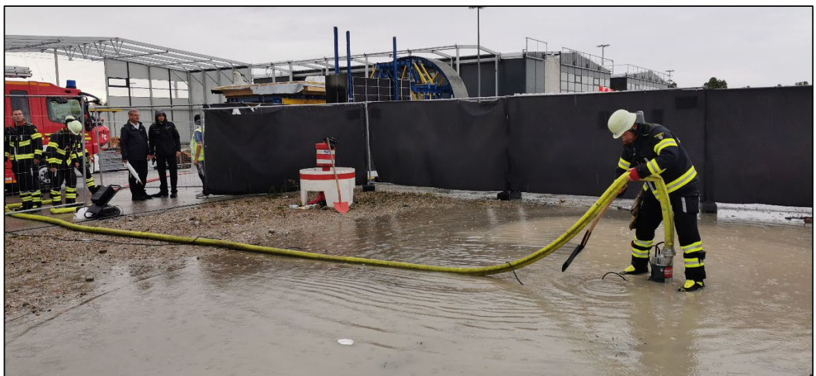
Abbildung 5: Einsatz der Feuerwehr nach Überschwemmung eines Veranstaltungsgeländes in Folge von Starkregen

Darüber hinaus ist die Flächenbeschaffenheit auch im Hinblick auf die Eignung und Nutzbarkeit für Maßnahmen der Gefahrenabwehr zu betrachten (vgl. Flächen für die Feuerwehr). In Anlehnung an das Baurecht soll jede Stelle der Veranstaltungsfläche mindestens innerhalb von 50 m fußläufig erreichbar sein. Bis dorthin ist eine ausreichende Erreichbarkeit mit Einsatzfahrzeugen erforderlich. Häufig können Veranstaltungsflächen für diesen Zweck hergerichtet werden. Je schlechter sich unter diesem Gesichtspunkt die Erreichbarkeit für Einsatzkräfte darstellt, umso eher sind veranstalterseitige Maßnahmen zur Kompensation in einem Sicherheitskonzept vorzusehen. Dies trifft in vergleichbarer Weise für die Löschwasserversorgung zu.