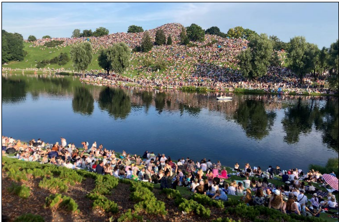
Abbildung 6: „Zaungäste“ eines Konzertes im Olympiastadion München im Bereich des Olympiaparks

Finden zeitgleich weitere Veranstaltungen, Versammlungen oder Aktionen mit einem räumlichen Bezug (z. B. im Rahmen der An-/Abreise) statt, müssen die möglichen Wechselwirkungen betrachtet und bewertet werden. Ggf. sind geeignete Maßnahmen abzustimmen und umzusetzen. Besondere Relevanz entwickelt dieser Aspekt, wenn sich die Veranstaltungen im Sinne von Gegenveranstaltungen thematisch aufeinander beziehen oder sich Personengruppen rivalisierend oder gar feindschaftlich gegenüberstehen.