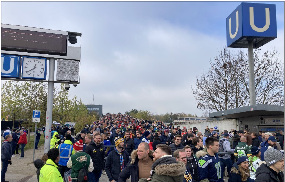
Abbildung 2: Regelmäßig erhöhte Personendichte im Abstrom einer stark frequentierten U-Bahnstation

Die Personendichte beeinflusst zudem maßgeblich die Bewegungsfreiheit, die Orientierung und die Möglichkeit zur selbstbestimmten Fortbewegung. Kritisch wird eine Situation insbesondere dann, wenn Besucher ihre Bewegungsrichtung nicht mehr frei wählen können, Ausgangsmöglichkeiten nicht mehr klar erkennbar sind und die Fortbewegung durch die Menschenmenge bestimmt wird.