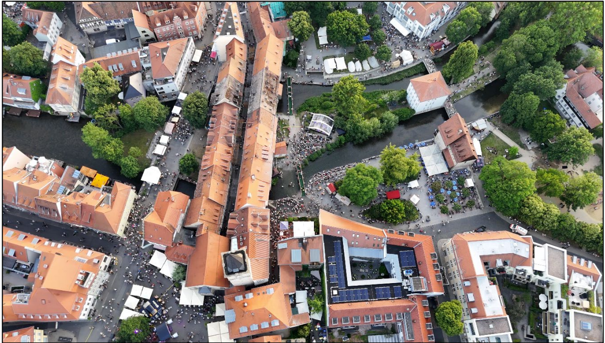
Abbildung 8: Veranstaltungsfläche mit Aufbauten in enger Altstadtlage