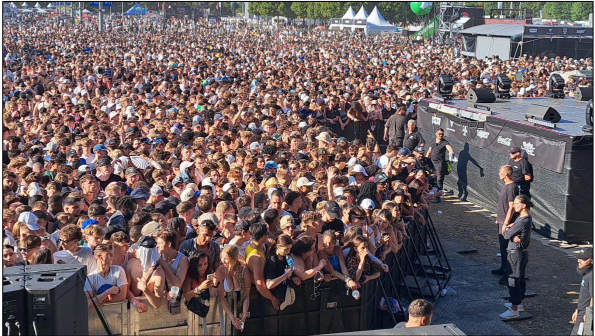
Abbildung 3: Augenscheinlich durchgängig deutlich erhöhte Personendichte im Bereich zwischen Bühnenabschrankung und 1. Abschrankung bei einem Open-Air-Konzert, Quelle: Branddirektion München